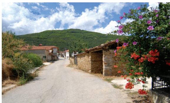
Слика 2: Куќа на кат со посложена современа концепција, с. Мокрени