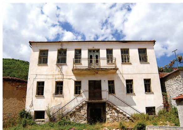
Слика 3: Стопански објект во с. Мокрени