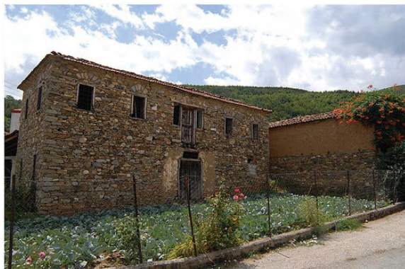
Слика 1: Куќа на кат од постар тип во с. Мокрени