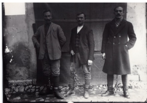
7. Дел од уапсените