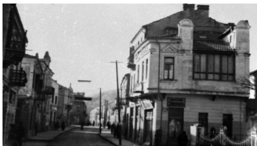
1. Местото каде е убиен Хаџи Поповиќ