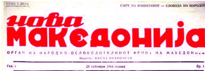
„Нова Македонија“, бр.1, I, 29 октомври 1944 година

скопската печатницата „Гоце Делчев” во село Горно Врановци, велешко. Весникот е врник на македонската државност, сведок и хроничар на настаните и развојот, кој одиграл голема улога во афирмирањето на националното достоинство на македонскиот народ и неговиот идентитет.