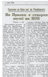
Напис од 05.05.1952 година