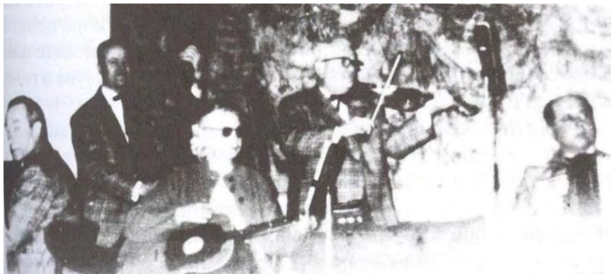
Оркестар „Шиндевци“ - Градска кафана, 1973 год.

Како одблесок на активниот живот во Прилеп, со својата масовност се истакнувал тамбурашкиот оркестар на монополот и оркестарот на гимназијата кој се користел за организирање и придружба на разни уметнички приредби и забави. Во знак на трајно сеќавање кое е меморирано кај постарите прилепчани од пред втората светска војна, па сè до седумдесеттите години на XX век, е групата „ Шиндевци “ која настапувала по разни локали и со разновиден репертоар. Целиот текст посветен на традиционалниот музички живот на споменатиот град, претставува кратко резиме на она што се случувало некогаш а исчезнало денес (Џимревски, 2005: 243).