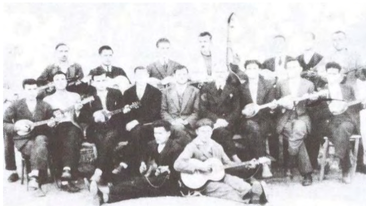
Монополски тамбурашки оркестар - Прилеп