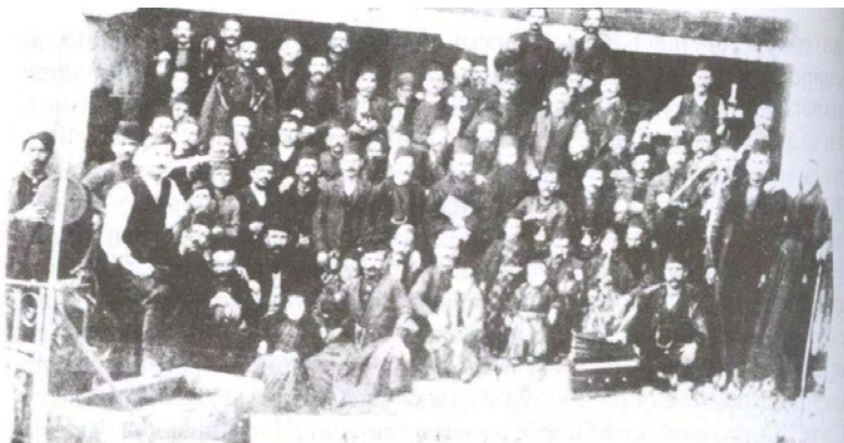
Прослава на мајсторот еснаф од Прилеп, 1910 год. Во манастирот „Трескавец“. Веселбата ја придружувал чалгиски состав. На левата страна е присутен дајреџија и лаутџија, а на десната виолинист, кларинетист и долу фисхармоника

виолина, кларинет и фисхармоника. Ваквите чалгиски состави малку биле познати во Македонија, особено со присуство на фисхармониката во чалгиското созвучје (Џимревски, 2005: 240).