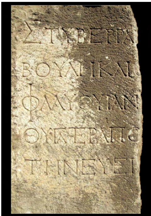
Сл.1. Епиграфски натпис, објект Булевтерион

плочки и имитацијата на штукo - декоративната техника на сидовите. Украсената површина била поделена на црвено обоено поле долу и кремovo обоени правоаголни полиња горе.